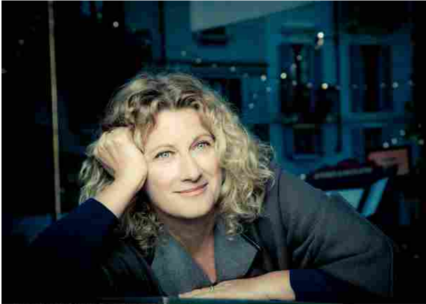
ANGELA FINOCCHIARO

Da venerdì 14 a domenica 16 settembre ritorna Festivalfilosofia che, come sempre, chiama a raccolta gli istituti culturali cittadini per proporre iniziative originali collegate al tema della kermesse filosofica, che quest'anno è "Verità". Sono tante le iniziative in programma per il 2018 nella Biblioteca Delfini e nel chiostro del Palazzo Santa Margherita che la ospita, in corso Canalgrande 103.